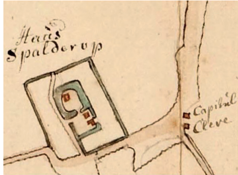
Uitsnede van een kaart uit 1795.