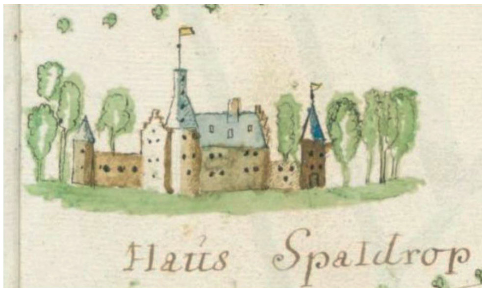
Aanzicht van Huis Spaldrop uit de atlas van 1701. (Landesarchiv Nordrhein-Westfalen, Kleve-Mark VII B, nr. 2.)

De oudste vermelding van Spaldrop is van 891-892, het vijfde regeringsjaar van Arnulf van Karinthië als koning van Oost-Francië en Lotharingen waartoe het huidige Nederland toen behoorde. In het document, dat wordt bewaard in het archief