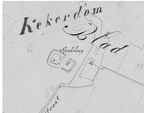
Fragment van een overzichtskaart van de kadastrale gemeente Leuth uit 1820