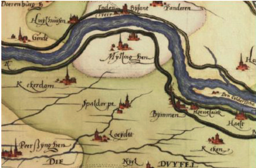
Uitsnede van een kaart van de cartograaf Christiaan 's Grooten uit 1573. (Koninklijke Bibliotheek Brussel, Handschriftenverzameling inv. nr. 21569)

was omstreeks 1537 waarschijnlijk kapelaan en Rulman Ruhenbecks in 1714 de protestantse bedienaar van de kapel. 24