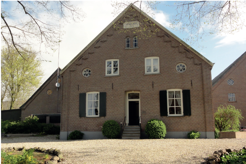
De voorzijde van boerderij Spaldrop met boven in de gevel de naam en het bouwjaar 1894 en rechts van de voordeur een steen met inscriptie ter herinnering aan de eerste steenlegging door rentmeester F. van Haaren op 10 augustus van dat jaar.

gebouw getekend. Op de oorspronkelijk aanwijzende tafel van het kadaster uit 1832 en opvolgende kadastrale leggers van de 19e eeuw staat het bij de beschrijving van het betreffende gedeelte van het Spaldrop-terrein niet als gebouw vermeld. Daar valt uit op te maken dat het toen niet meer dan een ruïne zal zijn geweest. Er zal zeker geen dak meer op hebben gezeten. Volgens overlevering was het resterende gebouw op de hoofdburcht 'de gevangentoren'. Dat het vierkante gebouw ooit als gevangenis heeft gediend, valt wel te betwijfelen. Als er op de burcht al een ruimte voor de opsluiting van gevangenen is geweest, lijkt het meer waarschijnlijk dat een kelder van één van de drie ronde torens van de burcht als zodanig werd gebruikt. In 1894 zijn de resten van het vierkante gebouw op de hoofdburcht bij de nieuwbouw van de boerderij Spaldrop afgebroken.