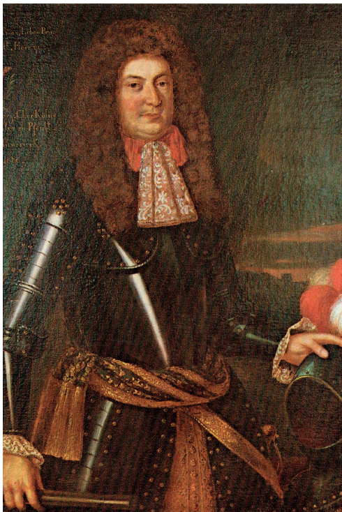
Roeleman (III) graaf van Bylandt, baron van Rheidt en o.m. heer van Spaldrop (omstr. 1603- vóór 1688). (Olieverfschilderij aanwezig in het Städtisches Museum Schloss Rheydt, Mönchengladbach-Reydt.