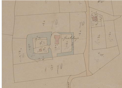
Fragment van een kadastrale kaart uit 1881. (Gelders Archief, 1117 Kadaster, grondbelasting, inv. nr. 637)

vierkante gebouw. Op de voorburcht staan twee gebouwen getekend. Deze gebouwen liggen op andere plaatsen dan het T-vormige boerderijgebouw dat staat getekend op een overzichtskaart van de kadastrale gemeente Leuth uit 1820, het kadastraal minuutplan van 1820-1832 41 en latere kadastrale kaarten. De oudere boerderijgebouwen op de voorburcht zullen derhalve tussen 1795 en 1820 zijn afgebroken. In die tijd zal ook de T-vormige boerderij zijn gebouwd. Op kadastrale tekeningen van 1881 en 1893 is te zien dat aan de plattegrond van deze laatst gebouwde boerderij op de voorburcht tot de sloop van het gebouw in 1894 niets is gewijzigd.