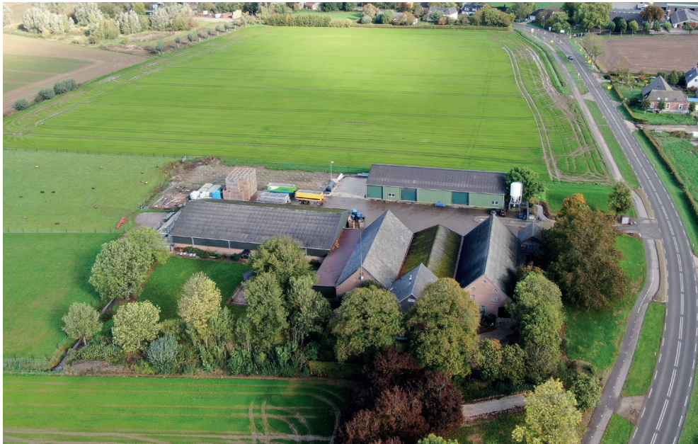
Boerderij Spaldrop vanuit zuidwestelijke richting. De burcht Spaldrop heeft gelegen ter plaatste van het bouwland dat grenst aan het erf en de Botsestraat.

Zoals bij de meeste andere voormalige kasteelterreinen het geval is, zitten ook bij Spaldrop onder de grond nog fundamenten van gebouwen die er hebben gestaan.